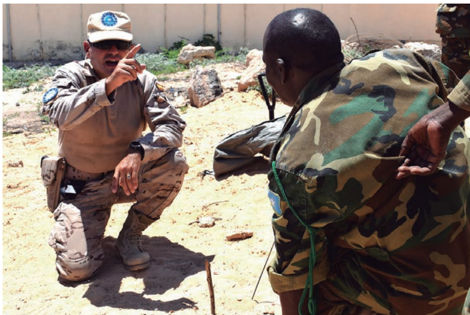
Los países que lo deseen podrán poner en marcha una misión o ampliar una ya existente si así lo decide una mayoría cualificada (en la foto, EUTM Somalia).

Esta fórmula de cooperación ya estaba incluida en el Tratado de Lisboa