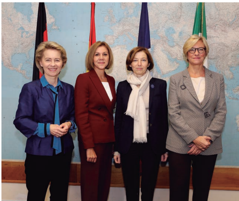
España, Francia, Italia y Alemania —en la foto, la ministra española con sus homólogas de esos países— han incentivado la política de defensa común.

El pilar está aposentado, ahora hay que continuar fijando el camino. Hasta este momento, los países han presentado más de 50 proyectos para desarrollar