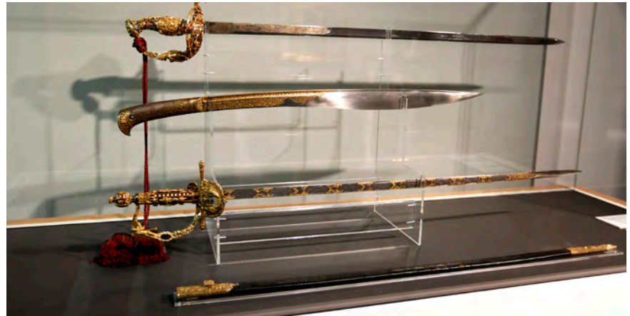
Ambulancia y mulo de transporte médico que sirven para presentar el estado de la Sanidad Militar de la época, a la que O'Donnell dotó de un reglamento nuevo durante su etapa de ministro de la Guerra. Armas joya del duque de Tetuán y del general Prim.

Las miniaturas de la Guardia Real de Fernando VII evocan la etapa. Luchó por el retorno del monarca y después en el Ejército de Isabel II durante la I Guerra Carlista, que esboza un audiovisual.