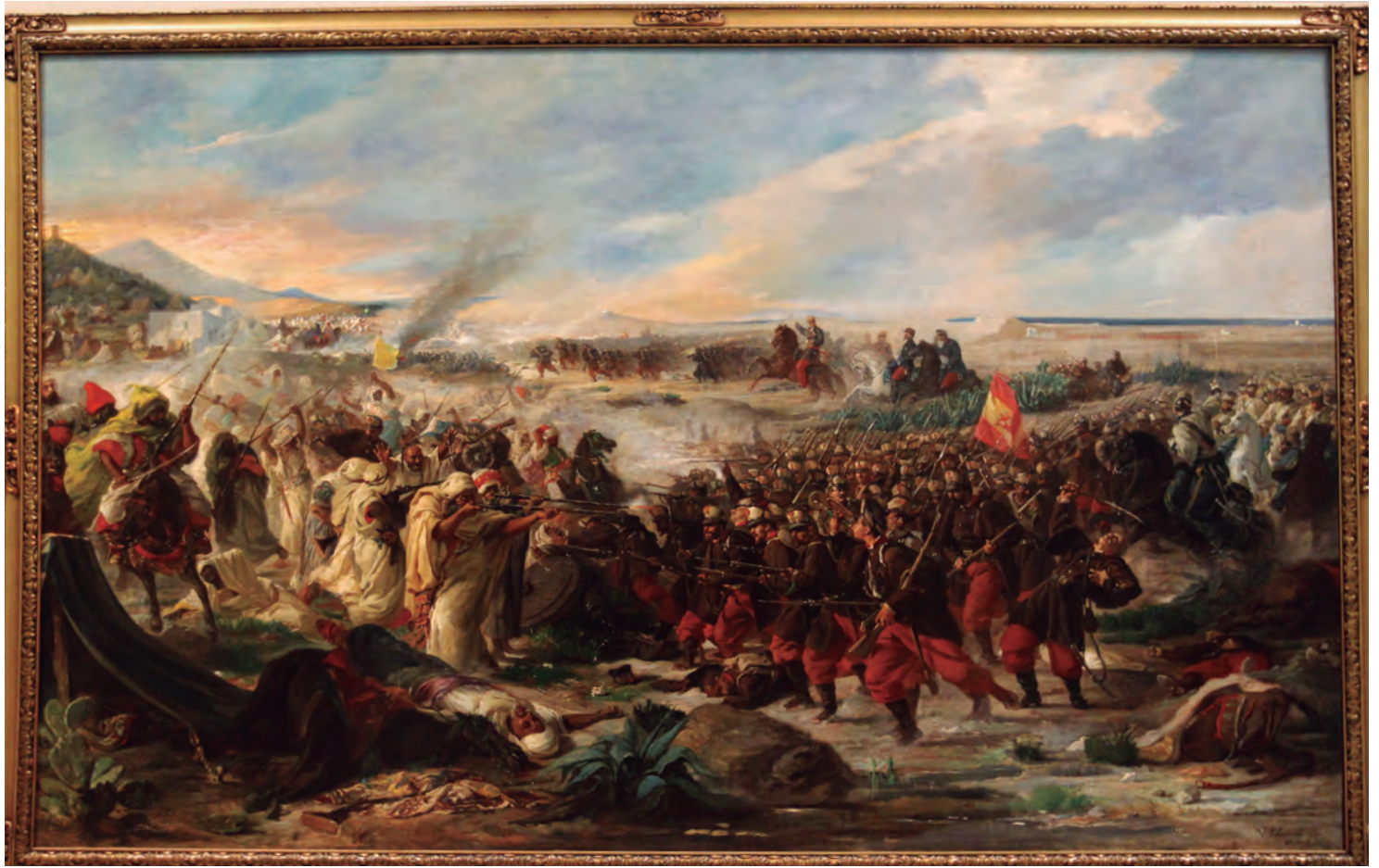
La Batalla de Tetuán , de Palmaroli, «imagen que más representa la exposición», en palabras de su comisario.