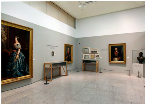
En las filas del Ejército de Isabel II (izquierda), O'Donnell ya sobresalió como líder militar en la I Guerra Carlista.

Leopoldo O'Donnell nació en Tenerife, en una familia muy tradicional y ligada a la milicia. Con 10 años estaba alistado. Pidió el ingreso, con sueldo, su padre, comandante militar de la isla. Solicitud al rey que se ha recuperado para la exposición a partir del original, muy dañado.