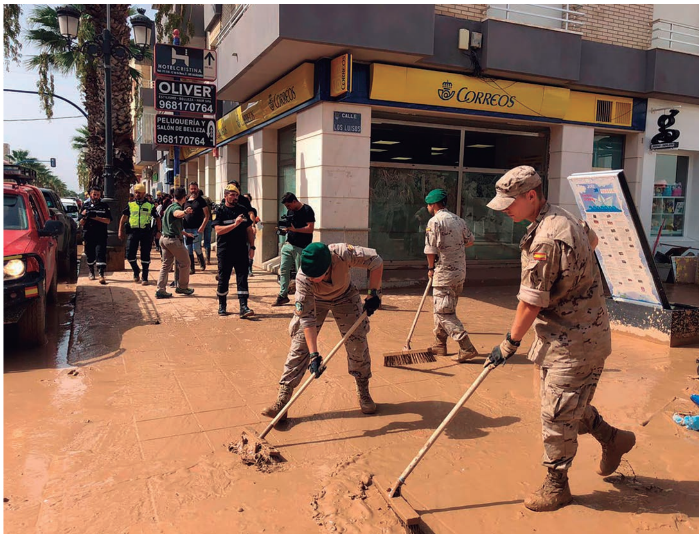
Ejército del Aire