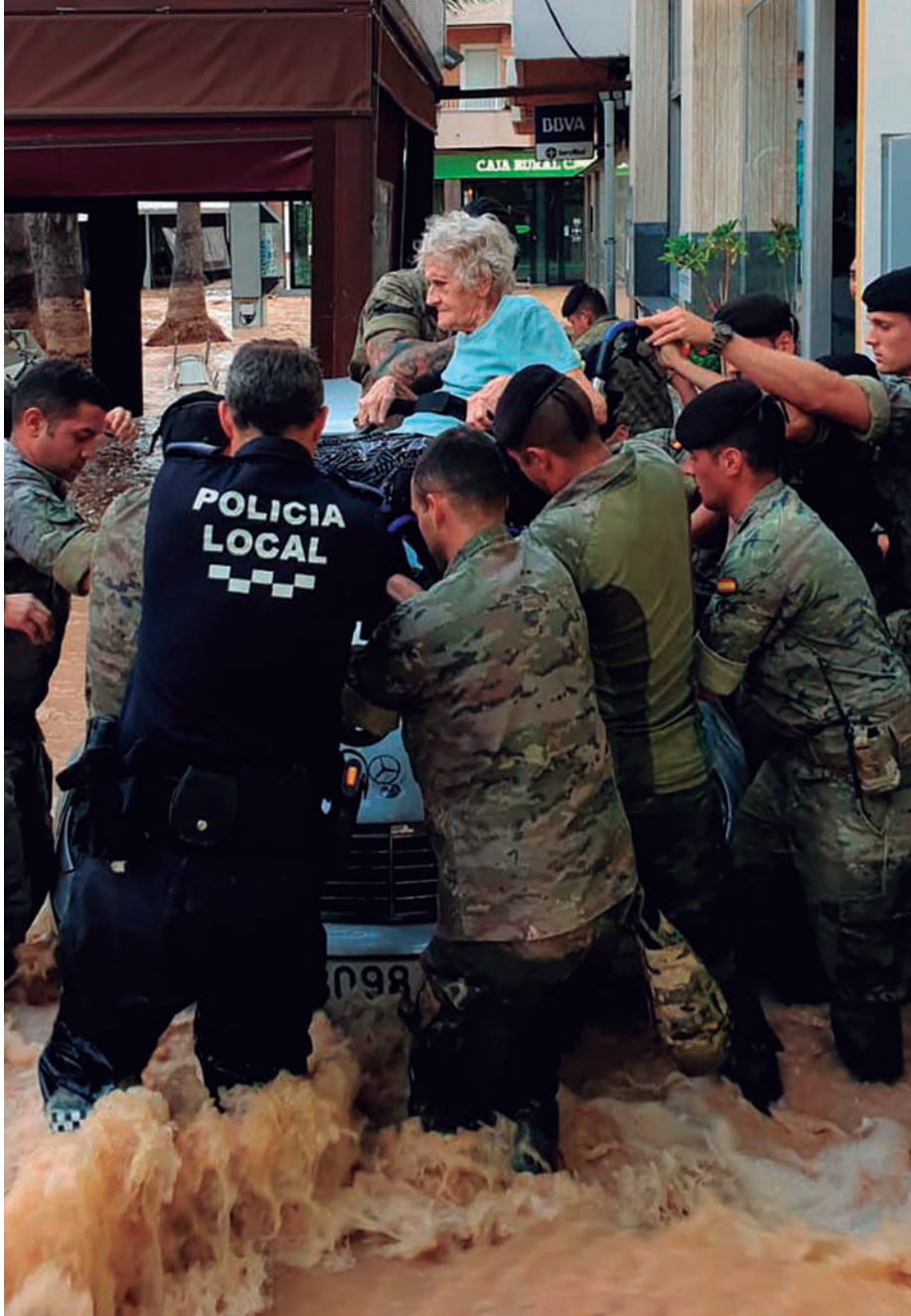
Ejército de Tierra

La UME coordinó a las unidades de los Ejércitos y la Armada