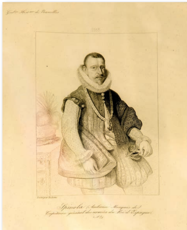
Museo del Ejército

A partir de ellas, las líneas que siguen esbozan el tiempo y la figura del genovés.