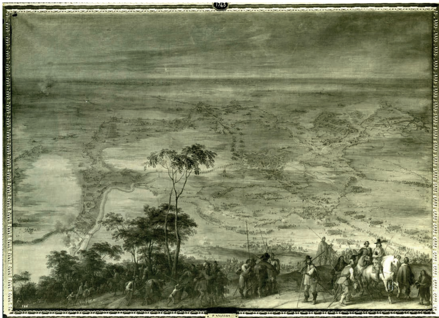
Fotografía (1955) del Museo del Ejército que plasma la Toma de la plaza de Breda , de P. Snyers, cuyo original conserva El Prado.

se inició en la milicia. Era el año 1601 y ya no la abandonaría hasta su muerte.