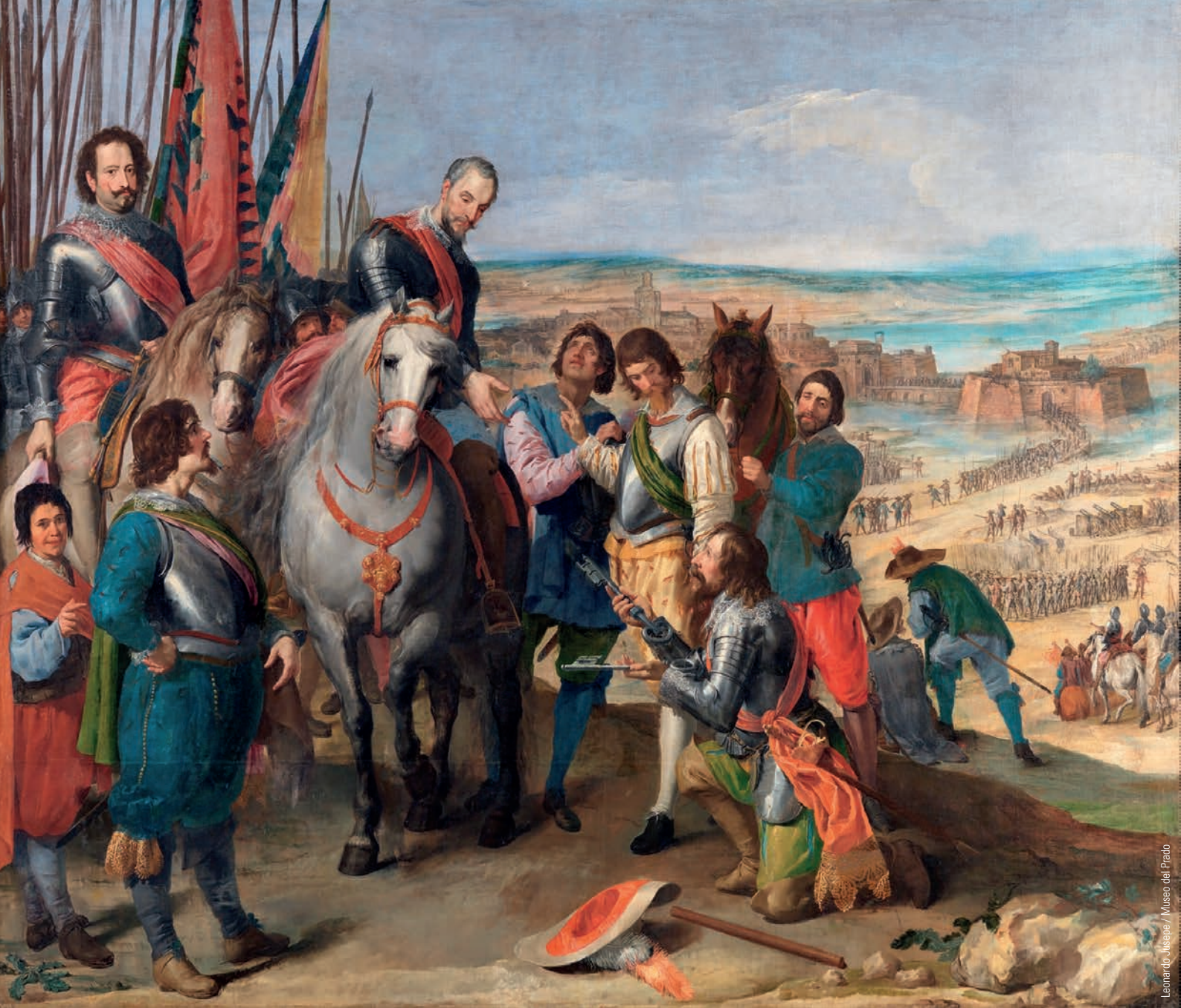
Leonardo, Jusepe