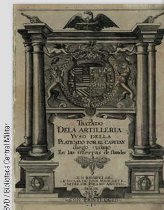
BVD / Biblioteca Central Militar

Tratado de artillería y de su forma de empleo, de Diego Ufano (1612).