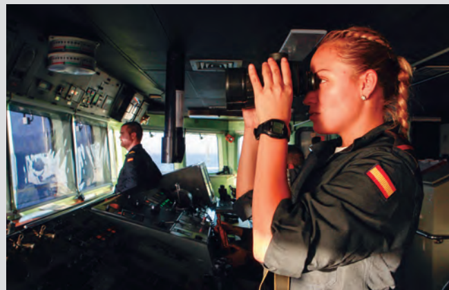
Desinfección de una instalación frente al virus (izda). El Hospital Central de la Defensa, el COVAM y los rastreadores han seguido activos en fiestas (centro). Aviones y buques han mantenido la vigilancia del espacio de soberanía (derecha). (Fotos Pepe Díaz).

L AS Fuerzas Armadas han seguido trabajando en Navidades por la seguridad y el bienestar de los españoles, tanto en nuestro territorio como en el exterior; y de un modo específico, han continuado aportando sus esfuerzos, a través de la operación Misión Baluarte , al combate contra la pandemia. En este ámbito han colaborado en el traslado a la población de las primeras dosis de vacuna, en el seguimiento de positivos y contactos por coronavirus y en la desinfección de instalaciones.