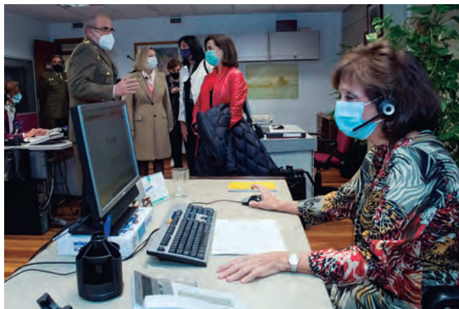
La ministra de Defensa, en su visita al ISFAS, donde inauguró la campaña «Nadie solo en Navidad en las Fuerzas Armadas».