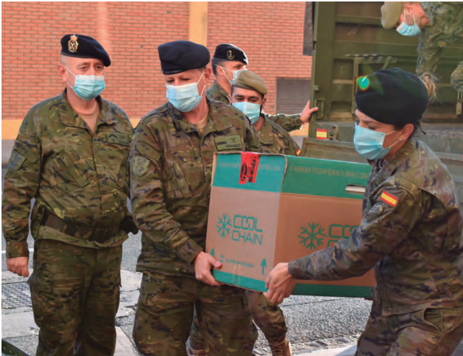
Gobierno de Melilla